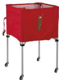
ART 1349 CARRELLO PORTAPALLONI ALLUMINIO PIEGHEVOLE