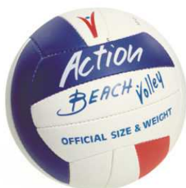
ART 2815 PALLONE BEACH VOLLEY RIO