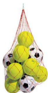
ART 1720 SACCO PORTA PALLONI

Telaio in alluminio, pieghevole ad ombrello con ruote, sacca portapalloni cm 62x62x47h, mis. cm 62x62x102h, borsa per trasporto.