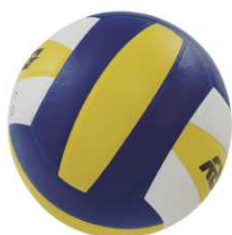
ART 2812A PALLONE VOLLEY COLLEGE

Rete a maglia larga, capacità 20 palloni.