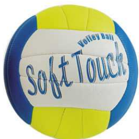
ART 2815A PALLONE BEACH VOLLEY SOFT TOUCH

Pallone Beach Volley a sezioni colorate, cucito.