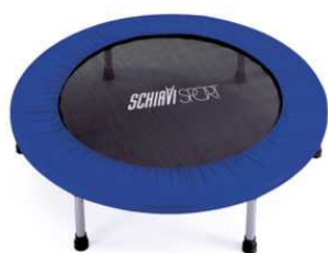
ART. 7011 TRAMPOLINO CIRCOLARE 98