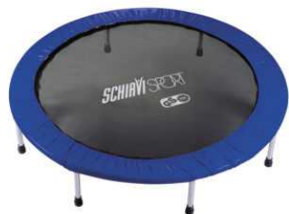
ART. 7010 TRAMPOLINO CIRCOLARE 137