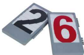
Tabella Meteore per segnapunti, numeri rosso o nero, composizione punteggio istantanea, visualizzazione a tendina, cm 33,5x19x2,6 ricambio